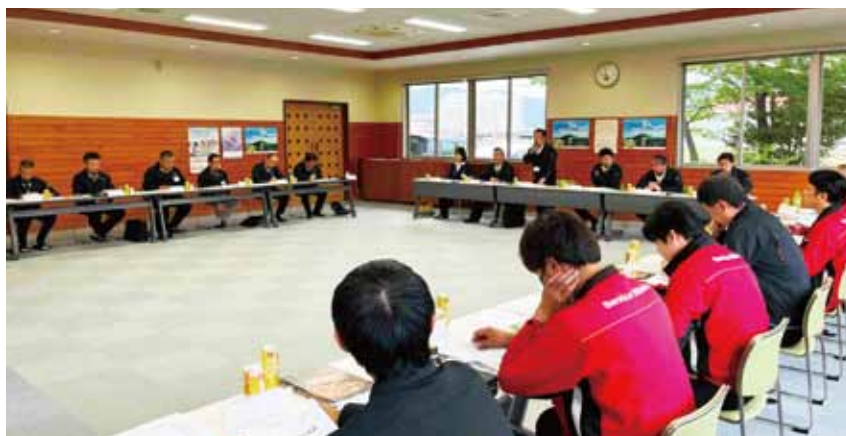
※写真右=購買部全体会議で決意を述べる 渋谷購買部長

購買部は今年度目標を72億円と掲げ、収益力の強化や安定供給の確保に取り組み方針です。