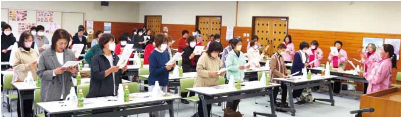
J A 役職員や部員ら約60人が参加して開催された女性部通常総会の様子