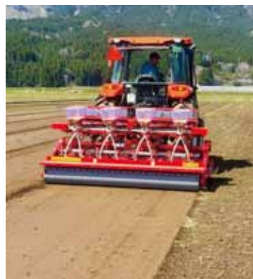
機械による乾田直播の様子

阿蘇地域で早期の田植え始まる 「乾田直播」で作業時間26%削減 品質も一等米相当と良好