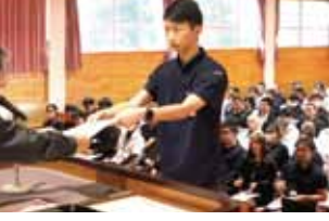
写真右上＝原山組合長の激励／写真上＝職員資格認定証書交付の様子／写真左＝全職員による「がんばろう三唱」

組織の基盤強化を図りながら、より力強いJA阿蘇を築いていきたい。JA阿蘇の職員として誇りを持って、職員全員が同じ方向を向き、業務に取り組んでほしい」と職員を激励しました。 大会終了時には、JA役員一同による本年度事業目標の早期必達に向けて「がんばろう三唱」を行い、より一層の団結を強めました。