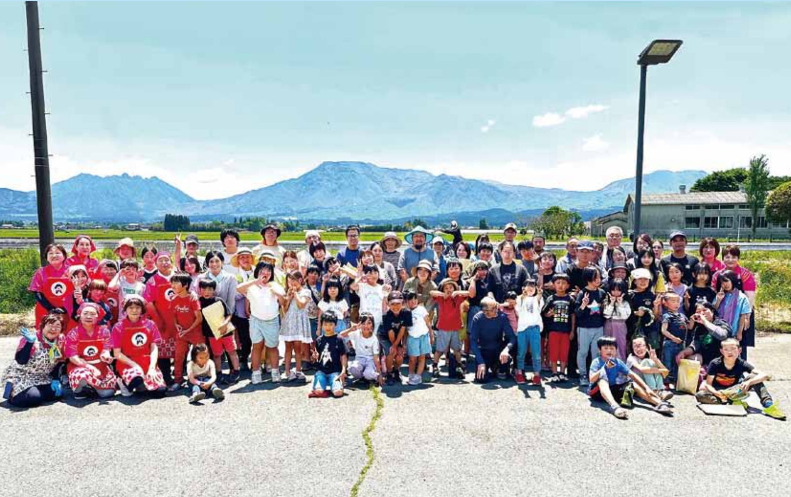
「まるごとあそっ子スクール親子で田植え体験イベント」に参加した皆さん(イベント内容は本誌9ページに掲載)