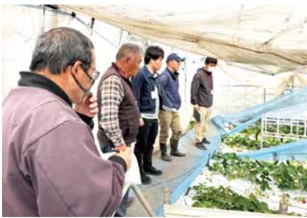
写真：部会役員による圃場視察の様子

J A阿蘇は今後も、販売担当者とリアルタイムで圃場状況を共有し、荷造り時のチェック態勢の強化を図り、市場や消費者への信頼向上に繋げていく方針です。