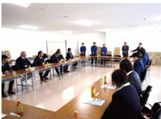
工場視察後の意見交換会