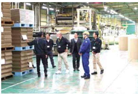
ダンボールの製造工程について説明を受ける役職員

J A阿蘇購買部は2月6日、熊本県内のダンボール工場を訪問し、視察研修を行いました。