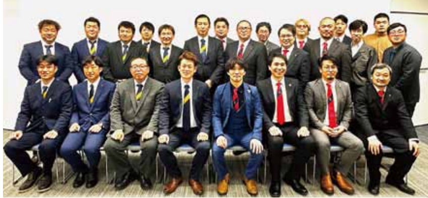
JA阿蘇青壮年部とJA上川青年部協議会盟友の皆さん

JA阿蘇青壮年部は1月21日、北海道を訪れJA上川青年部協議会と合同で「青年部活動における農政活動への携わり方」と題してグループディスカッションを開催しました。