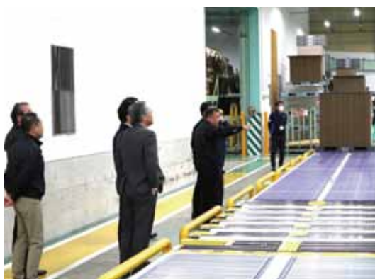
製造工程の一連の流れの説明を受ける役職員

J A阿蘇は今回の学びを今後の業務に活かし、より高い付加価値を提供できる体制づくりを進めていく方針です。