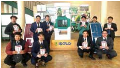
写真(上) = JA上川青年部協議会とのディスカッションの様子 / 写真(下) JA阿蘇青壮年部盟友の皆さん