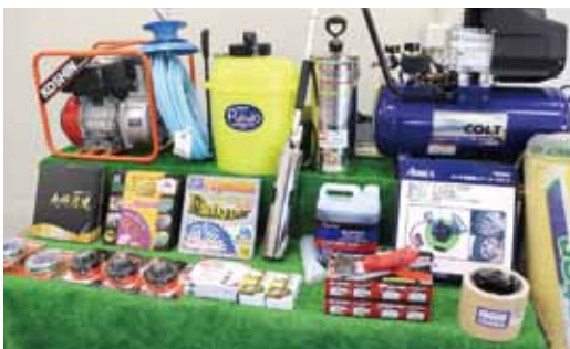
写真(右) = アグリノベーション開会式の様子 / 写真(上・下) 会場で展示されたトラクターや最新の農業機器やツール