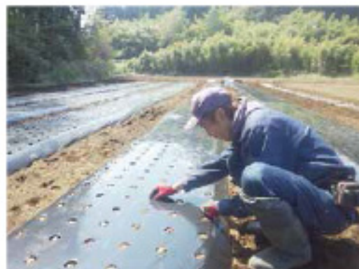
グラジオラスの植え付け作業をする生産者

野尻地区では、グラジオラスの栽培が行われています。同地区のグラジオラスはハウス栽培と露地栽培があり、ハウスでは2月上旬から3月下旬、露地では4月上旬から6月下旬まで植え付け作業が行われます。