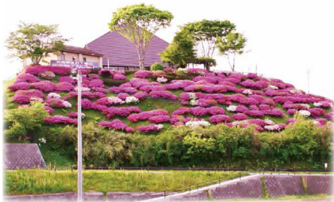
JA阿蘇小国郷物産館「びらみっと」のツツジ