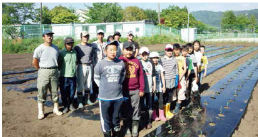
↑野菜作りに参加した小学生と盟友

青壮年部盟友より作業手順などの説明があり、畝作り・マルチ張り作業後に子供たちが穴を開け播種しました。参加した子供たちは「初めての農作業だったが、お兄さんたちが優しく教えてくれたので楽しかった」と喜んでいました。