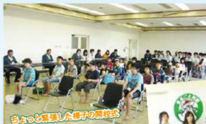
ちょっと緊張した様子の開校式