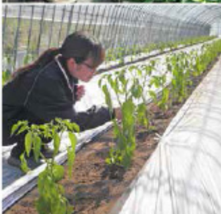
生育状況を確認する担当職員(写真上=4月上旬撮影、写真下=定植後5月中旬撮影)

ハウス栽培が中心の高森地区では近年「アザミウマ類」による被害が拡大しており、その対策として本年産は天敵昆虫「スワルスキー」の導入が行われました。