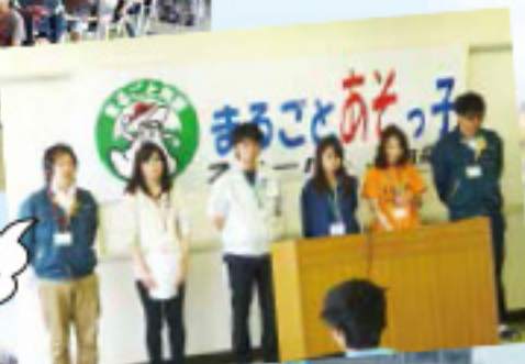
皆さん、よろしくネ! あそっ子担任の先生の紹介