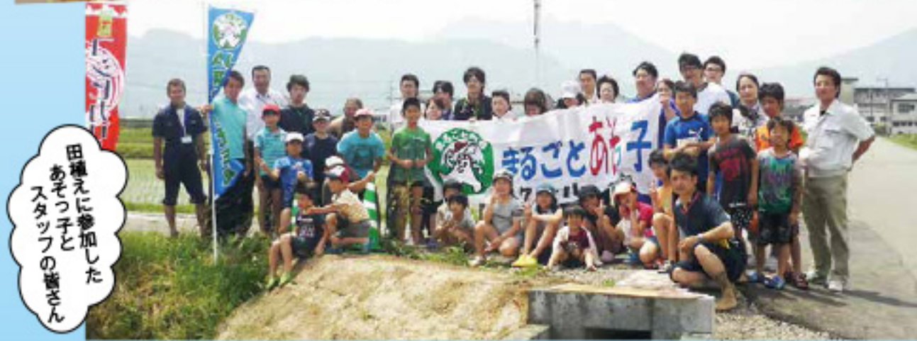
田植えに参加した あそっ子と スタッフの皆さん