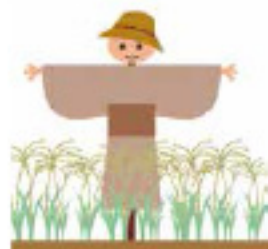
↓ 直播された初種子