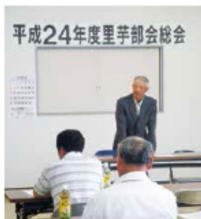
平成24年度里芋部会総会