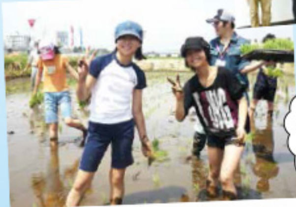
あそっ子たちは 嬉笑顔で 田植え体験