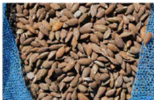
↑ 鉄コーティングされた初種子