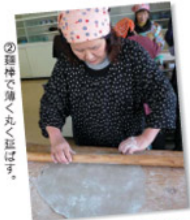
②麺棒で薄く丸く延ばす。