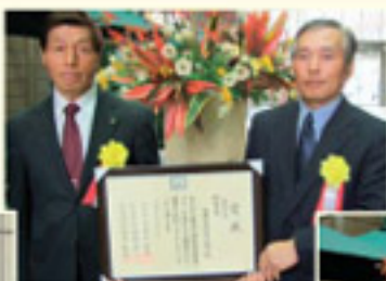
↑組織農業部門 優良賞の阿蘇町 大豆生産組合