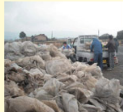
中部地区で回収された「廃プラ」の山

中部管内の一の宮町・旧阿蘇町では3月17・18日の2日間、一の宮選果場及び阿蘇町集荷場で廃プラスチック回収を行い、延べ185人の組合員が半年間の廃プラスチック(ポリ・ビニール・シート・灌水チューブ・肥料袋など)約16t回収しました。持ち込んだ組合員からは「回収をしてくれて良かった、片付いた、半年に1回は必ず行ってほしい」など、感謝の声が多く聞かれました。