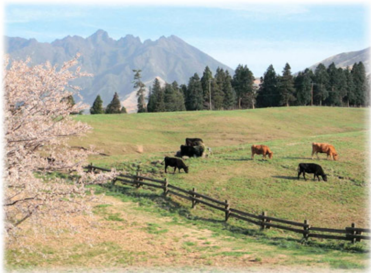
仙酔候ふもとの牧場から根子岳を望む