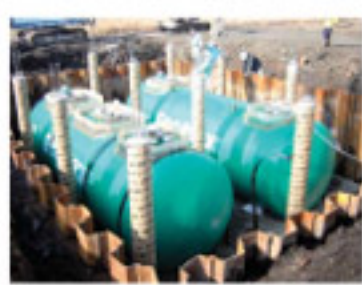
設置工事中のFF二重殻タンク

今春オープンしたJA阿蘇2店舗目となるセルフ給油所「阿蘇町給油所」では、建設工事中の1月28日、地下タンク2基の埋設工事を行いました。埋設された地下タンクは(株)タツノ・メカトロニクス製のFF二重殻タンクで、県下JA初採用で、九州でも福岡、佐賀に次ぐ3番目です。