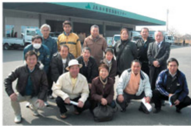
先進地研修に参加したJA阿蘇各園芸部会役員の皆さん

視察した園芸流通センター施設内には最先端の真空予冷施設、パレットラック保管庫、ケースラック保管庫などが備えられています。