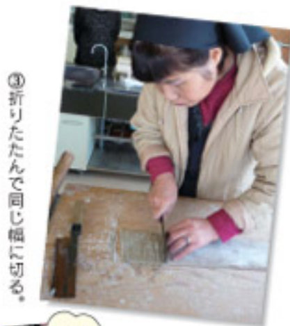
③折りたたんで同じ幅に切る。