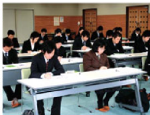
真剣な表情で研修会に取り組む新入職員

2010年度JA阿蘇新規採用職員の研修会が2月18日、一の宮中央支所で開かれ28人が参加しました。