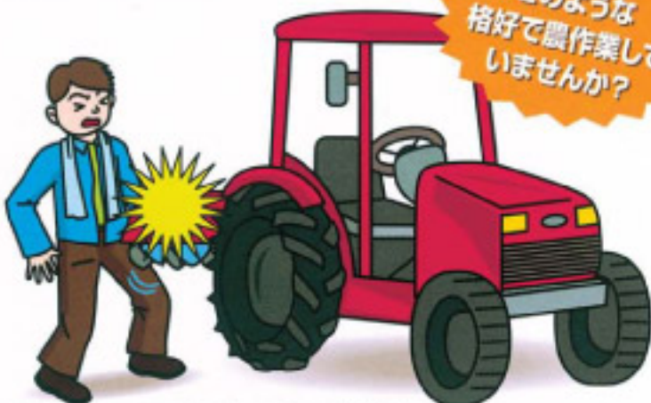
(例)トラクターのPTO軸ジョイントへの衣服の巻きつき