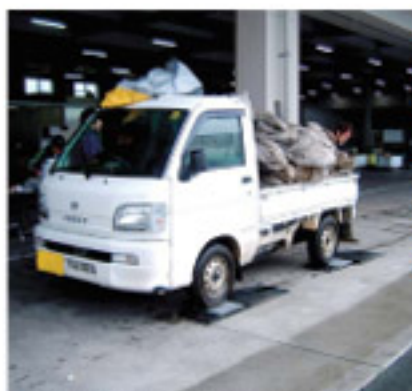
持ち込まれた廃プラスチック類

南部地区では3月9・10日の2日間、農業用廃プラスチック類の回収を実施しました。今回は管内の南阿蘇村を対象に全戸に呼びかけ、古ビニールやマルチ資材など2日間で約25tが集まりました。