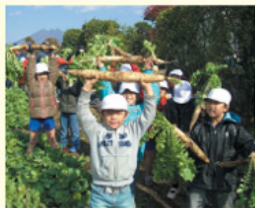
ダイコン収穫を体験した子どもたち

J A阿蘇青壮年部高森支部は11月21日、高森中央小2年生41人と町内の畑でタマネギ苗植えと大根収穫を体験しました。同支部の盟友が「タマネギの苗は弱いのでやさしく扱って下さい」と説明し、児童は慣れない手つきながら丁寧に植え付けていました。その後、同小学校3年生が種まきをした大根の収穫を行い、なかなか抜けない大根に苦労しましたが、青壮年部が協力し無事収穫作業が終了しました。今回収穫した大根は授業参観の時、J A女性部が指導し、保護者と一緒に切り干し大根作りを行う予定です。