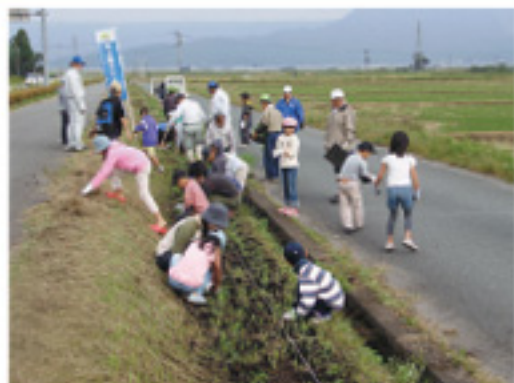
コスモスの苗を植える子どもたち

水土里ネット阿蘇(阿蘇土地改良区)は10月12日、農家と地元の子どもたち約30人を募り国道212号線沿い(300m)にコスモスの苗3000本を植えました。 子どもたちは慣れない手つきで一先懸命植え、また、農道のゴミや空き缶拾いをしました。袋いっぱいゴミにびっくりした様子で、自分たちで農道をきれいにする事ができたことで、みんな満足した様子でした。