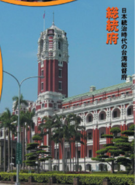
日本統治時代の台湾総督府