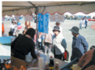
安心・安全なJA阿蘇の農産物は大人気!

J A阿蘇小国郷中央支所は10月16日、南小国町で行われた「きよら祭」に出店し、ジャーシー乳製品や焼きそば・ソーセイジなどを販売しました。祭りでは地元学生の演奏披露やマジックショーなどたくさん催し物が行われ、また天候にも恵まれたため、大勢の米場客で賑わいました。