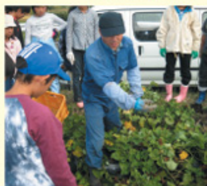
大きなサツマイモに 大感激...