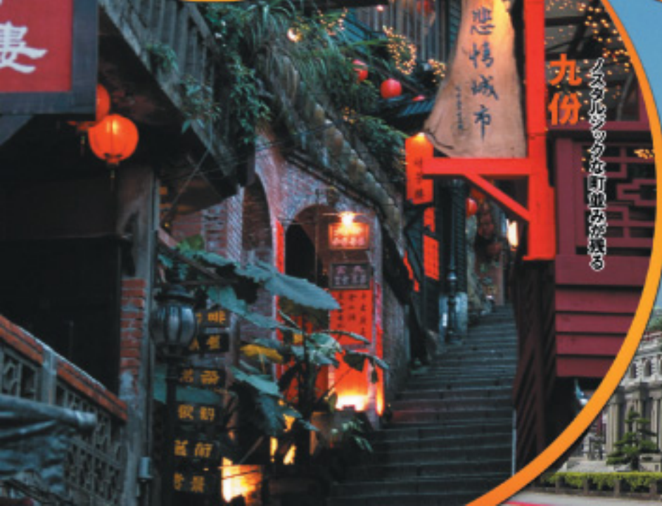
ノスタルジックな佇まいが残る九份