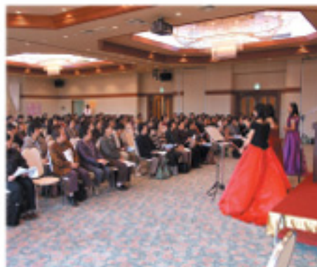
フルート演奏で始まったオープニング

第6回J A阿蘇女性部フォーラム「家の光大会」が11月5日、阿蘇いこいの村で開かれ部会員ら約200人が出席しました。オープニングセレモニーは、女性フルート奏者3人による「おしゃべりコンサート」で始まり、会場にはアメイジング・グレイスや千の風になってなど優しいフルートの音色が響き渡りました。