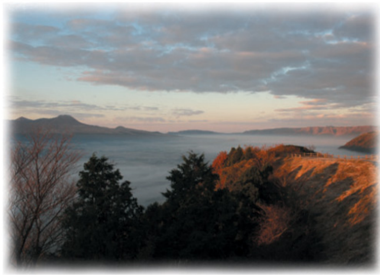
城山付近から阿蘇谷を望む