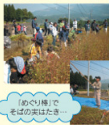
「めくり棒」で そばの実をはたき...