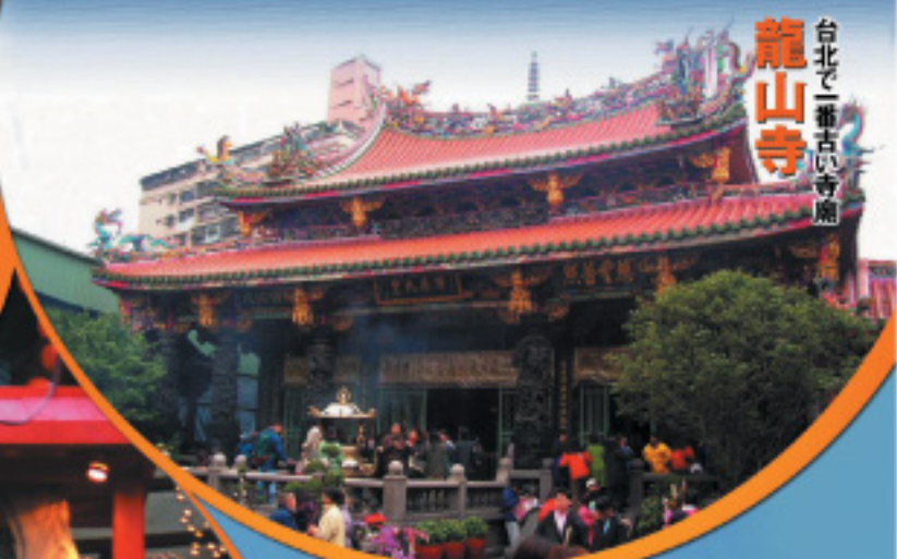
台北で一番古い寺廟