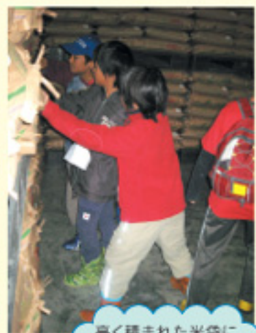
高く積まれた米袋に びっくり!