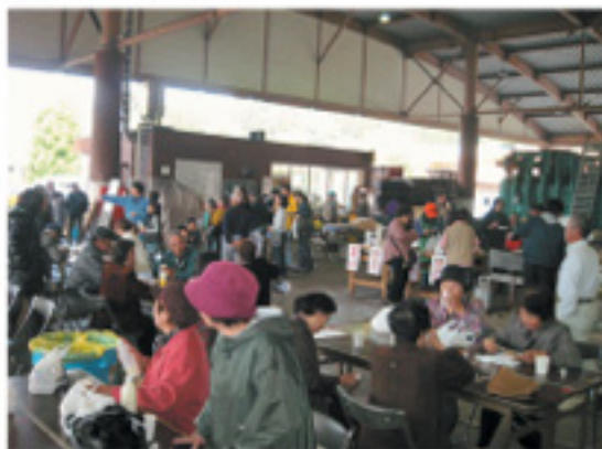
大好評だった各種のバザー