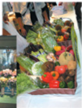
阿蘇の新鮮野菜が勢強い

やわらかくておいしい」と驚いていました。新米コシヒカリの試食も大好評で、販売先の問い合わせも多く寄せられていました。新米つかみ取りコーナーではアンケートに答えた買い物客が列を作り、少しでも多くつかみ取るうと思戦苦闘をしていました。