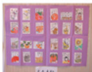
各女性支部 みなさんの作品も展示 （写真中・下）