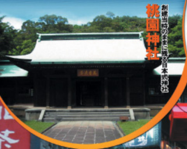
創建当時のままだと見る日本神社の雄姿