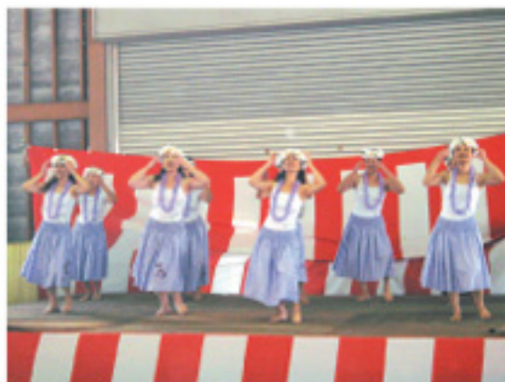
フラダンスに会場の観客もうっとり...

11月15日、小国郷中央支所は野菜集荷場で今回で8回目となる収穫感謝祭を開きました。会場ではJA職員の各種バザーや生産部会、女性部・青壮年部の大鍋料理やあか牛焼肉、惣菜販売が行われ、大勢の来場客で賑わいました。