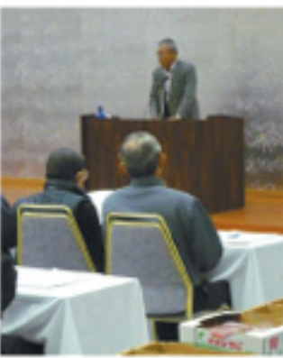
甲斐二六部会長の挨拶

中部イチゴ部会は11月21日、阿蘇市で08年度産イチゴ査定会を開き、生産者や行政・JA・市場関係者ら約90人が参加しました。