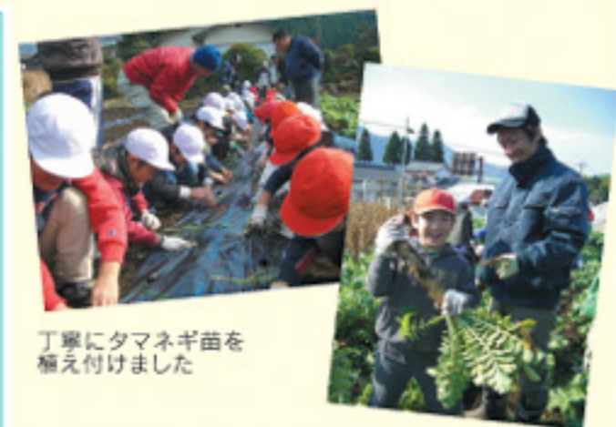
丁寧にタマネギ苗を 植え付けました