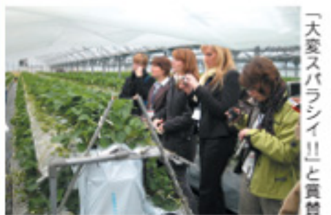
「大変スバラシイ!!と賞賛

文科省交流事業の日独勤労青年交流団(女性9人)が11月6日J A阿蘇を訪れました。同様の視察団が交流事業でJ A阿蘇を訪れるのは初めてであり、一の宮中央支所でJ A阿蘇の事業内容の説明を受けた後、畜場や米倉庫、野菜選果場を見学しました。