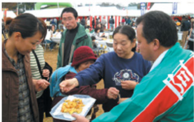
西原産サツマイモの天ぷらに人だかり…