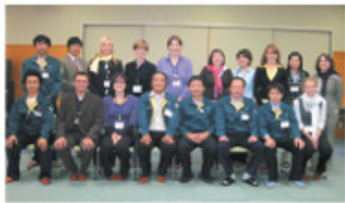
あか牛料理に大満足