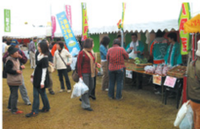
JA阿蘇コーナーには次々とお客さんが来店