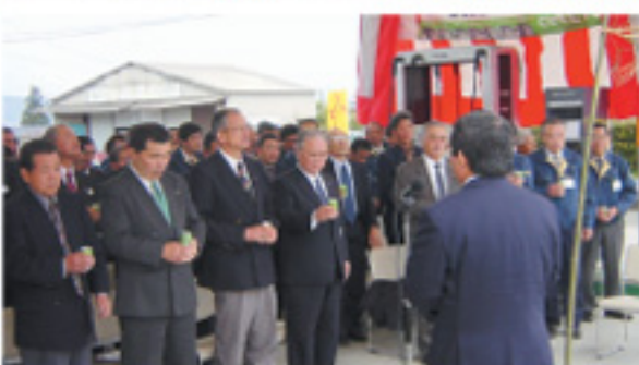
写真（上5点）はいずれも落成式の様子