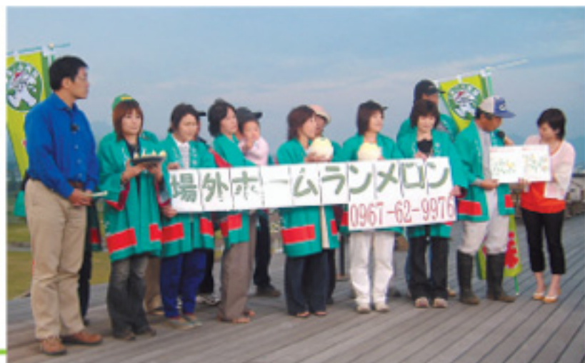
NHK熊本放送局番組「クマロク」に出演中の白水メロン部会員の皆さん

んな甘いメロンは食べたことがない」と絶賛していました。 この場外ホームランメロンは年々固定客も増えており、一昨年の発送数量はJA取扱分だけでも445ケース、昨年は978ケース（前年比219%）となっております。県内はもちろんのこと東北地方まで発送されています。問い合わせはJA野菜センターTEL0967（62）9976へどうぞ。