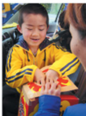
お客様に大好評だったオープンイベント