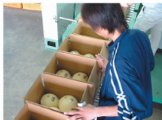
メロンの品質チェックを行う担当職員

出荷は第1陣となる西原地区のホームランが5月末まで。肥後グリーンが5月中旬から6月中旬までです。今年は生育・玉肥大ともに良好で、担当職員は「期待以上の大玉で糖度も15度以上あり、美味しく、安全安心のメロンを消費者へ届けることができる」と自信を持って話していました。また、同管農センター管内のメロン部会は、ポジティブリスト制度を遵守するとともに、消費者の手に渡っても生産者が特定できるように生産者番号入りのシールを1玉ずつに貼って出荷しています。