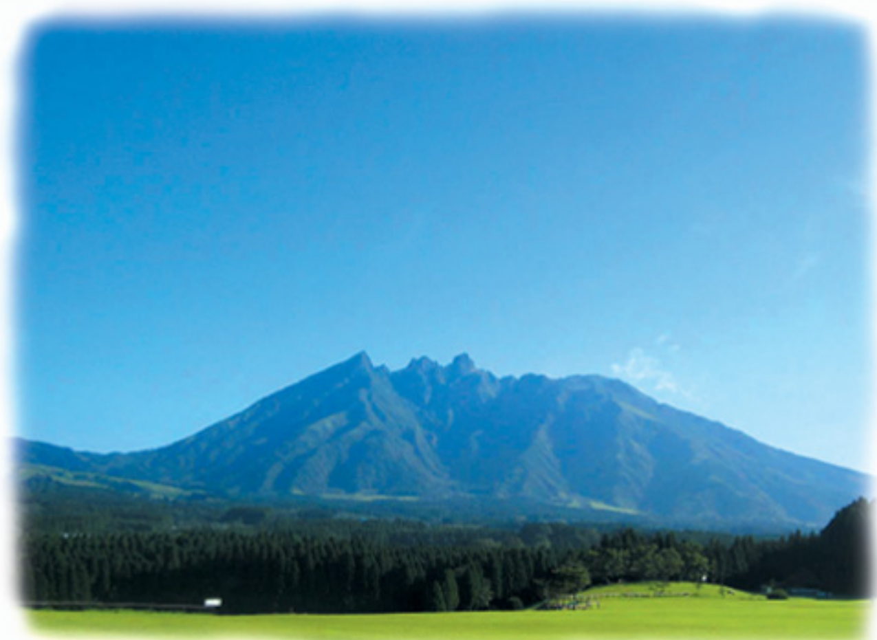
高森町月更り運動自然公園付近から見た「根子岳」