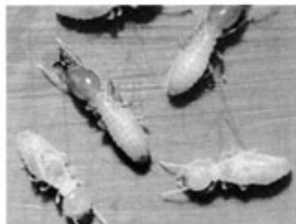
イエシロアリと働きアリ

シロアリは一年中活動しています。 シロアリの駆除・予防は今すぐお近くの農協へ まかせて安心、完全施工、完全保証で我家は万全