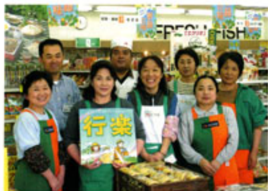
Aコープ蘇陽職員の皆さん