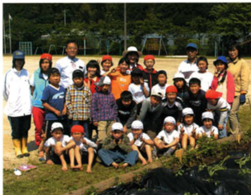
産山北部小の子供たちと先生方