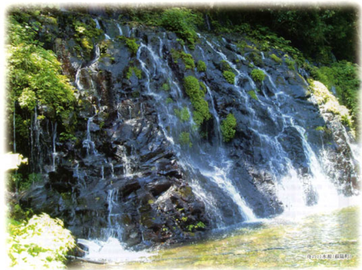
向の口水淵(蘇陽町)