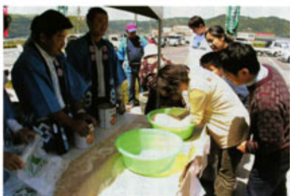
大好評だった「米のつかみどり」