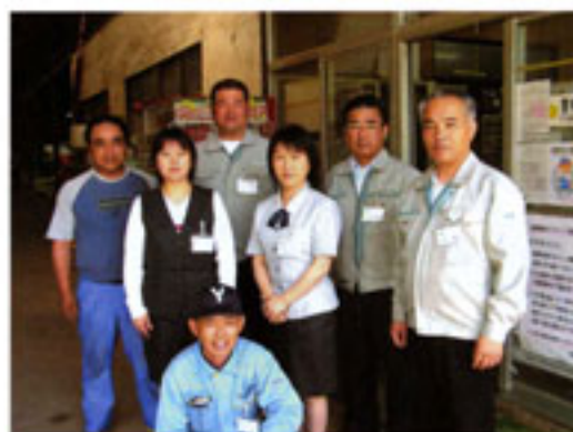
草部支所職員の皆さん

組合員の方々のニーズを把握し、より密着した関係で気軽に入力できる支所づくりをいっそう進めていきたい」と語っていました。