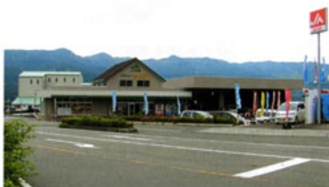
グリーンなんごうの外観

14人(支所駐在・臨時職員含む)の利用者はほとんどが組合員やJ A関係者ですが、一般客の利用もあるそうです。