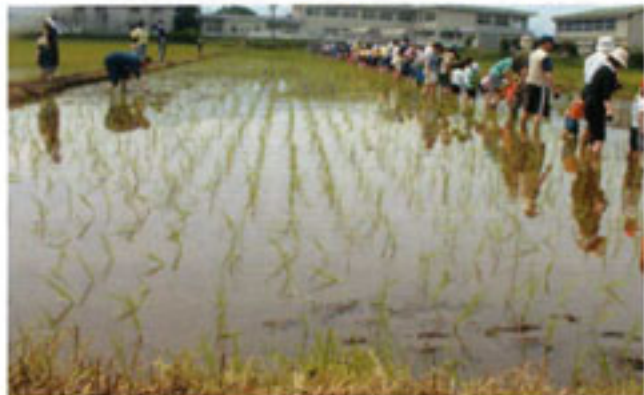
泥だらけになって初めての田植え