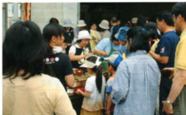
田植えの後はみんなで交流会

5月22日、JA阿蘇「阿蘇町良質米部会」はグリーンコープ生活協同組合くまもと県央北の組合員260名を招き、地元生産者30名と一緒に阿蘇町山田地区の水田で田植え交流会を行いました。「レッツゴー田んぼ」と名付けられたこの企画では15