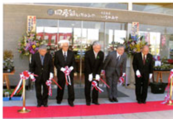
関係者によるテープカット