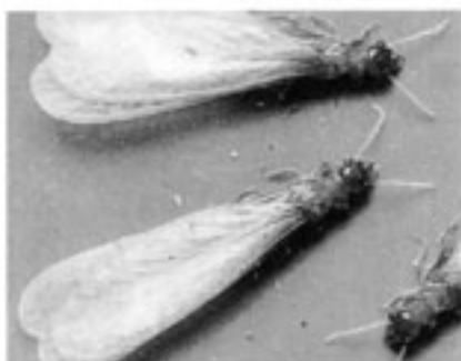
イエシロアリの羽アリ