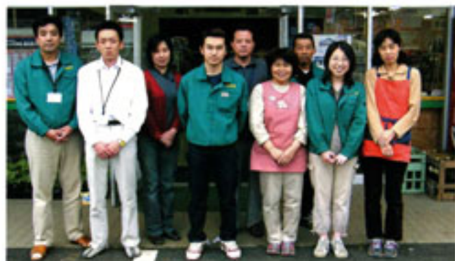
グリーンなんごう職員の皆さん

蘇陽町の服掛松キャンプ場から細い山道を谷下に降ると「舟の口水源」があります。岩の割れ目や山ひだから湧水が流れ落ち、一帯は清涼感あふれる雰囲気になっています。初夏にはホテルの幻想的な乱舞も見られ、秋には近くの長崎鼻展望所から「蘇陽峡」の雄大な紅葉が楽しめます。