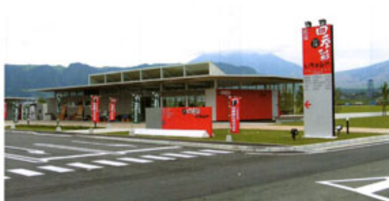
オープンした「四季彩いちのみや」