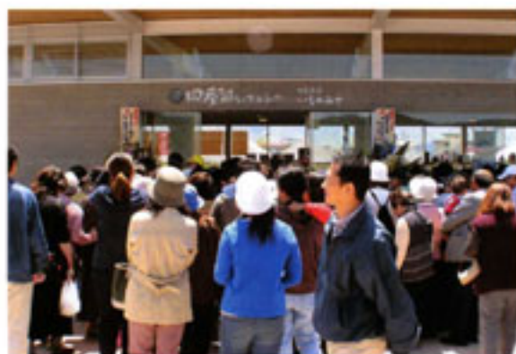
開店前から大勢の人だかり