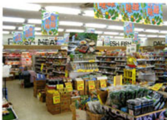
Aコープ蘇陽の店内

着任した田上店長は、「これまで今までの店長や職員が築き上げてきたものを大切にしながら、『Aコープ』という名前を汚さないように頑張りたい。地域密