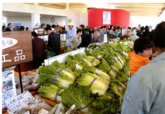
「直売コーナー」には新鮮な農作物がいっぱい