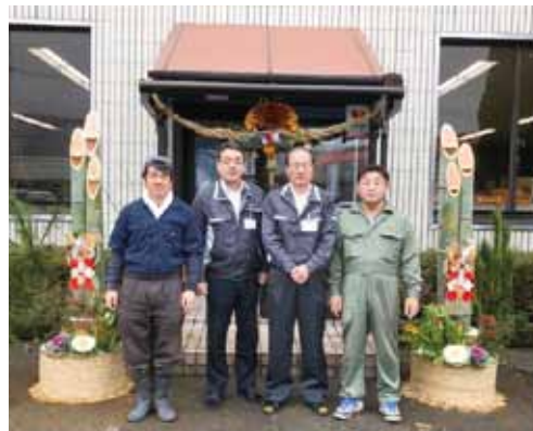
青壮年部によって本所玄関に飾られた門松