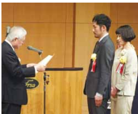
大会会長の熊日社長から表彰状が授与