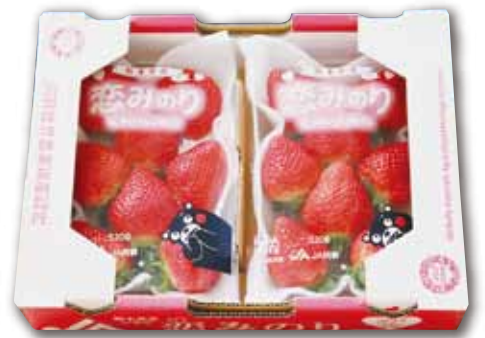
いちご2パックセット

イラスト違い探し「火振り神事」5か所の違いを、官製はがきに書いて応募してください。正解者の中から抽選で7名様に写真の商品をプレゼントします。締め切りは3月15日(当日消印有効)です。