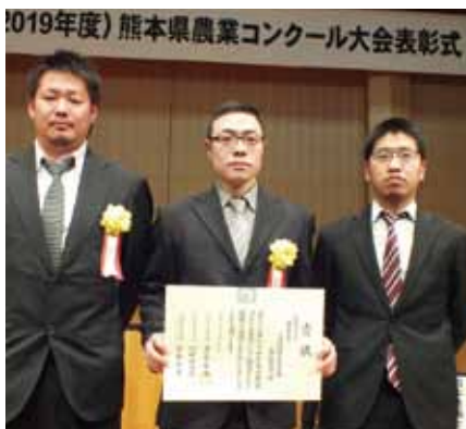
JA阿蘇青壮年部高森支部盟友