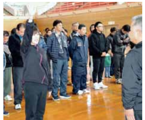
終始笑いの絶えない熱戦(?)となった「ふらばーるバレーボール大会」の様子