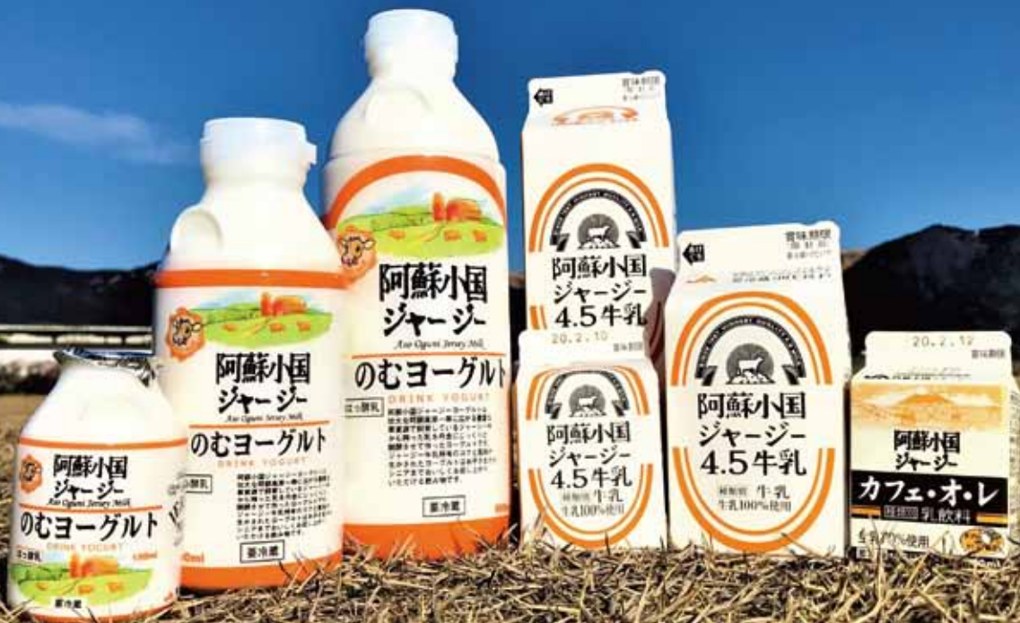
『阿蘇小国ジャージー』商品の数々