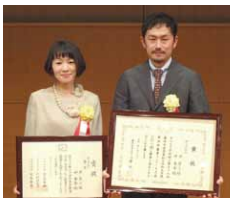
新人王部門「秀賞」に輝いた井夫妻

主な品目・取り組み 繁殖牛 他産業の経験を経てUターン就農。秀抜な繁殖成績で就農定着。病気予防や分娩事故削減のためICTを積極的に活用。民間企業と連携したスマート農業開発や自家育成牛のレストラン提携、地域の未利用牧野の整備にも取り組む。