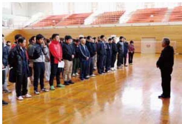
ふらばーるバレーボール大会の開会式

12月7日(土)午後、阿蘇市体育館でJA阿蘇互助会親善ふらばーるバレーボール大会が開催されました。