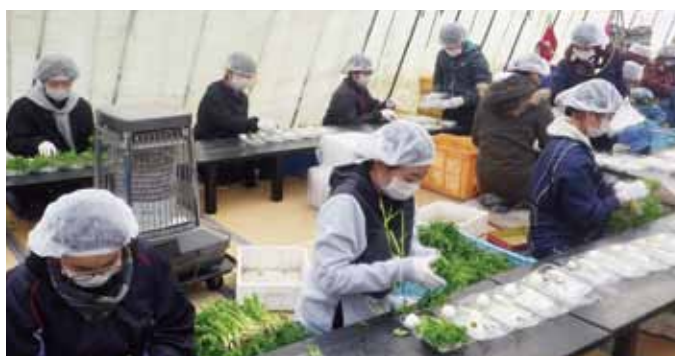
写真=いずれも七草の1つ1つを丁寧にパック詰めする生産者の皆さん(昨年12月28日撮影)