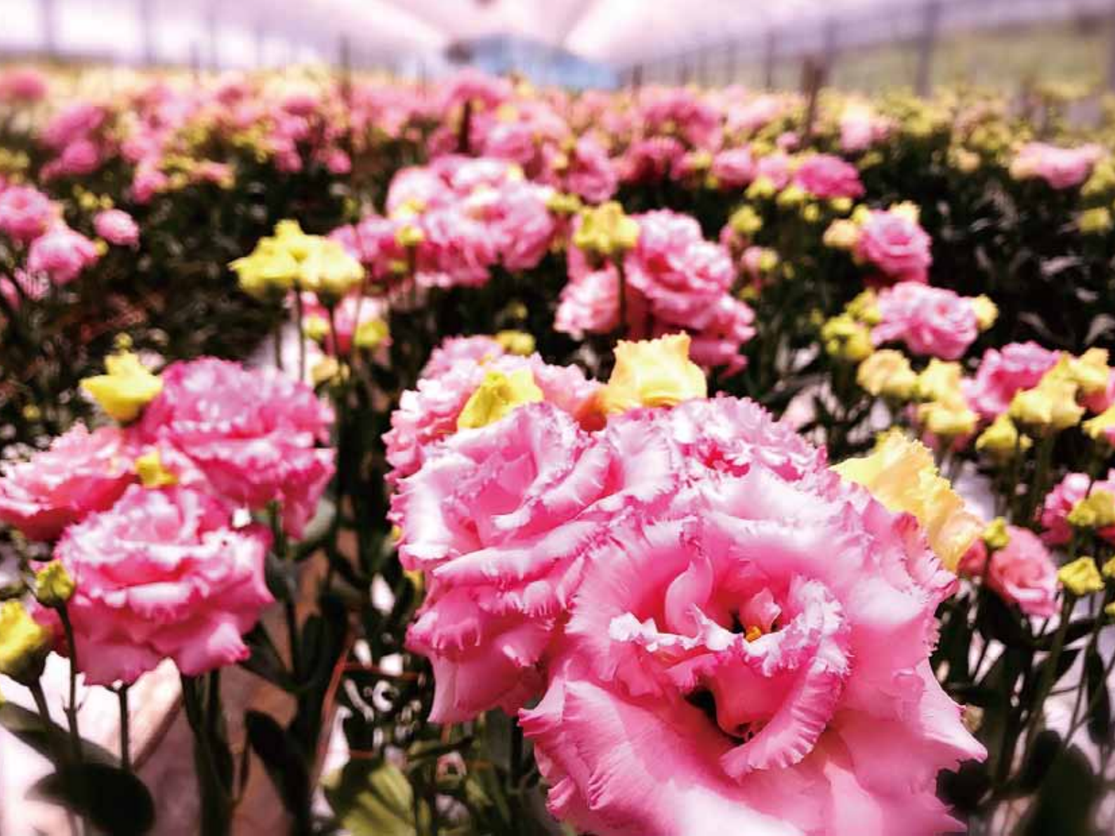
「トルコギキョウ」