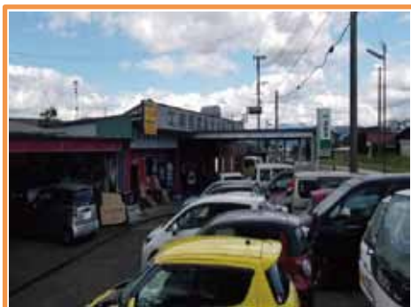
(有) 宮崎钣金塗装工場

〒869-2226 阿蘇市乙姫221-2 TEL:0967-32-1209 FAX:0967-32-0256