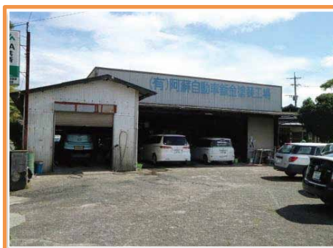
(有) 阿蘇自動車钣金塗装

〒869-2301 阿蘇市内牧1198-4 TEL:0967-32-1844 FAX:0967-32-1931