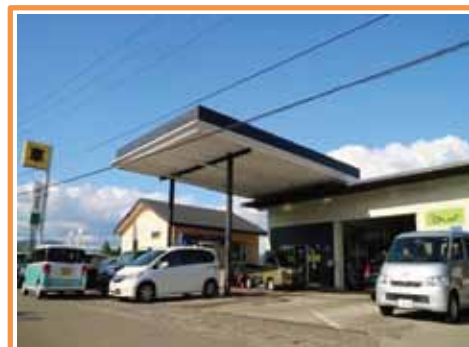
(株) オートリファイン ショウジ

〒869-1411 南阿蘇村河陰4496-2 TEL:0967-67-1338 FAX:0967-67-1885