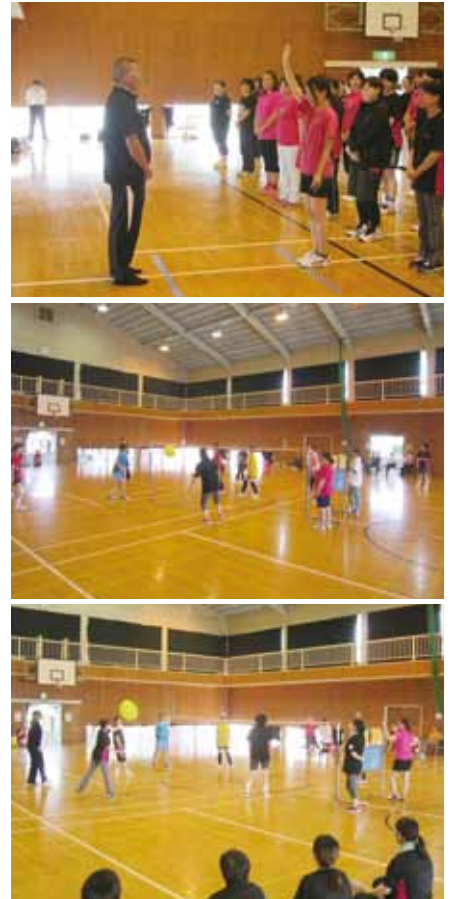
写真はいずれも「ふらばーるバレー大会」のひとコマ