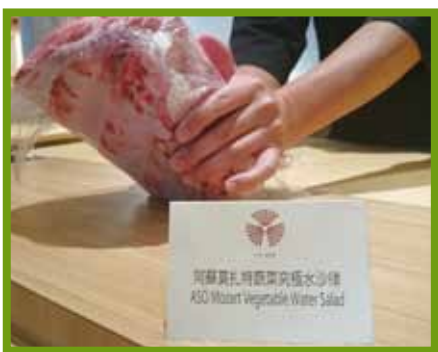
写真左＝阿蘇産農畜産物にも大きな関心が寄せられた 写真下＝「香港in阿蘇地域世界農業遺産フェア」関係者の皆さん

当日の夕方からは、香港在住の県人会の方々との意見交換会、懇親会も行われ、JA阿蘇の事業展開と農産物の一層の販売拡充へ「さらに応援を続けていきたい」旨の発言が寄せられました。