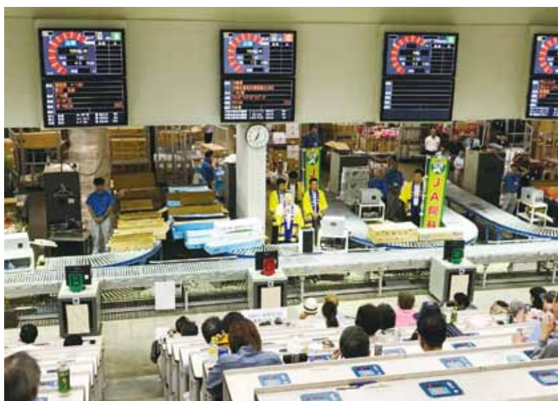
挨拶をする原山組合長ら)