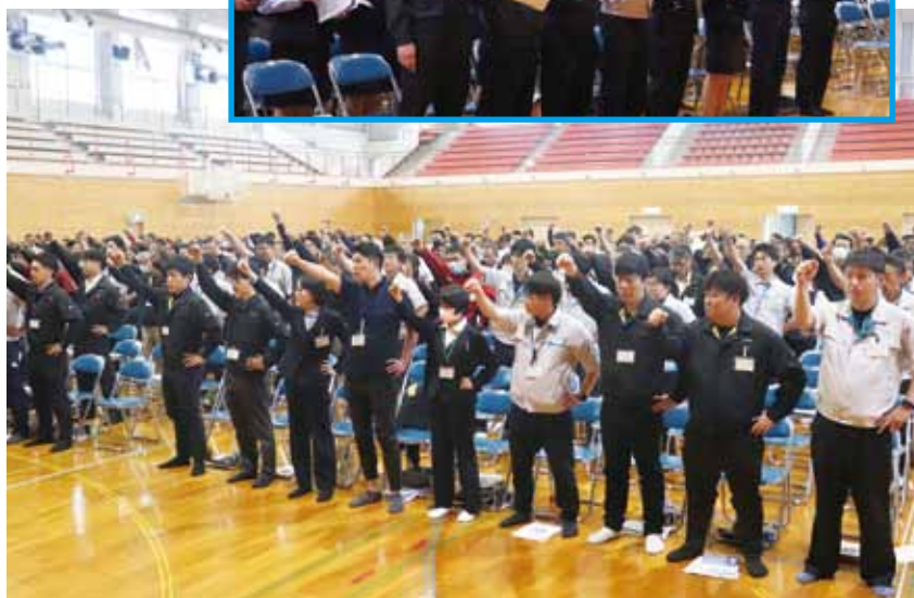
↑ 事業目標の早期必達に向けての『がんばろう三唱』