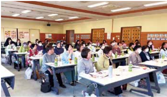
↑JA阿蘇女性部通常総会の様子／↓Aコープ商品研修会の様子

J A 阿蘇女性部は4月26日、一の宮中央支所で2024年度女性部通常総会を開催し、J A 役員や女性部員ら約60名が出席しました。総会では令和6年度事業報告や令和7年度事業計画など4議案が可決されました。24年度は3カ年計画の最終年度として、SDGsを意識したフードドライブ活動やドライフード作製、地域の環境を守るクリーン活動などを実施しました。女性部では今年度より新たな3カ年計画の基本方針を掲げ、食農教育