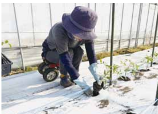
トマト定植作業の様子

JA阿蘇中部トマト部会は(3月下旬の取材時)2025年産トマトの定植期を迎えました。生産者145人が総面積約40haに作付けました。