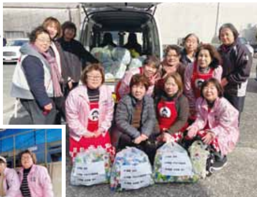
ペットボトルキャップを回収した JA阿蘇女性部の皆さん