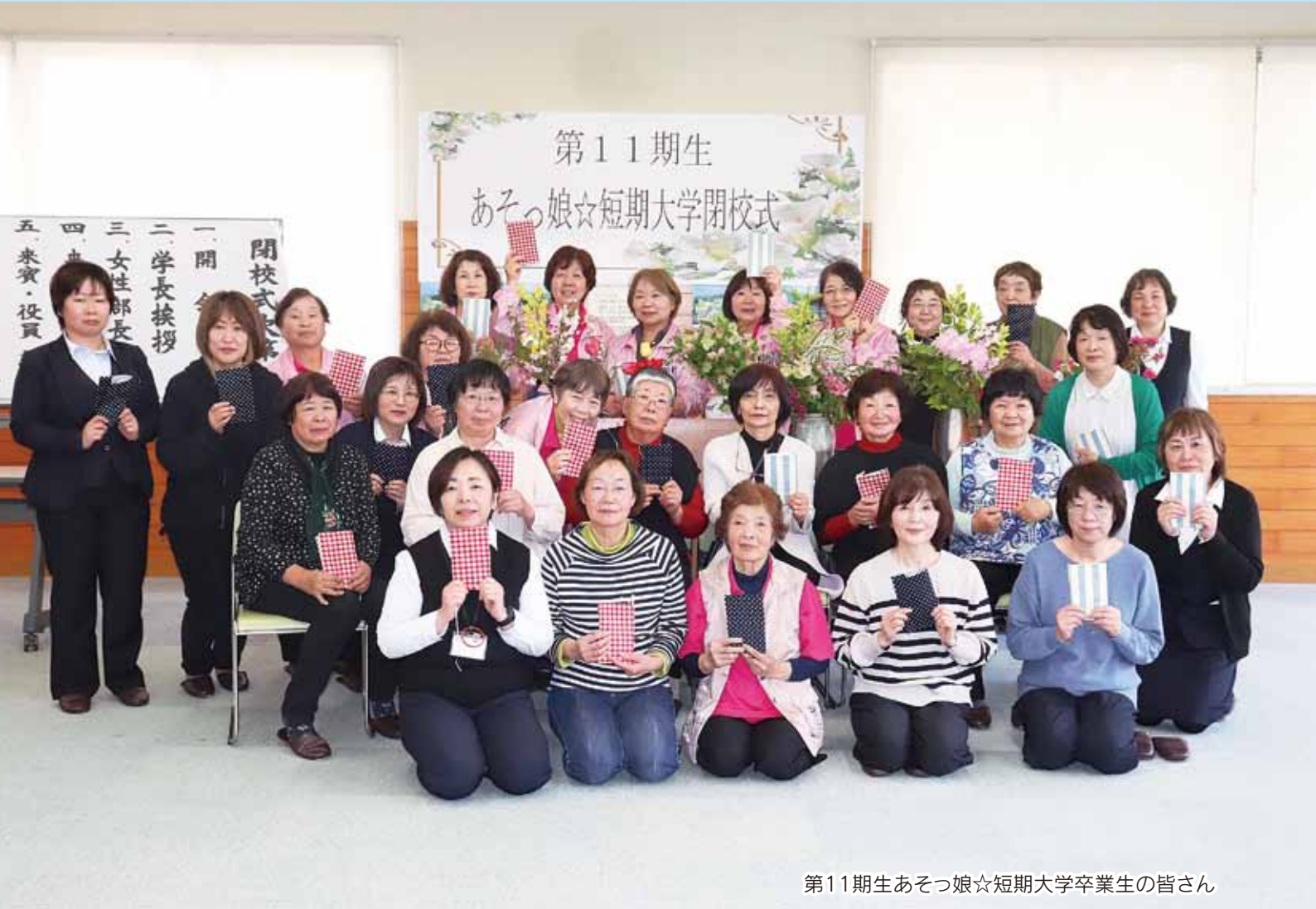
第11期生あそっ娘☆短期大学卒業生の皆さん